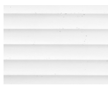
PX-143 9003 Tiffany