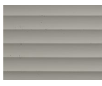
PX-143 7030 Tiffany