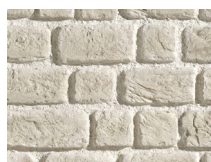
PX-185 Wall Brick Titanio