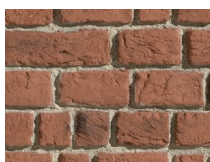
PX-183 Wall Brick Red Cassel