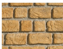
PX-184 Waal Brick Ocre