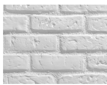
PX-002 9016 Refractario