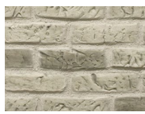
PX-070 Refractario Gris