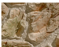
PX-079 Oviedo Gris Musgo