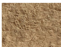
TX-010 ORO Etna