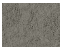
TX-010 7039 Etna