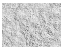
TX-010 9016 Etna