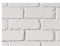
PX-147 9016 English Brick