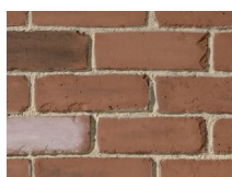
PX-147 English Brick