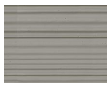
PX-141 7030 Cortina