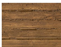
TX-033 Beton Tablas Madera