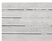
TX-022 2502 Beton Tablas