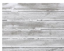
TX-035 Beton Tablas Envejecido