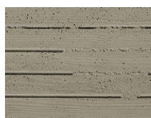
TX-022 Beton Tablas